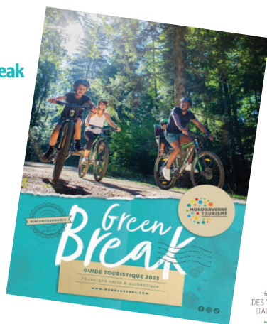
- La carte touristique Mond'Arverne