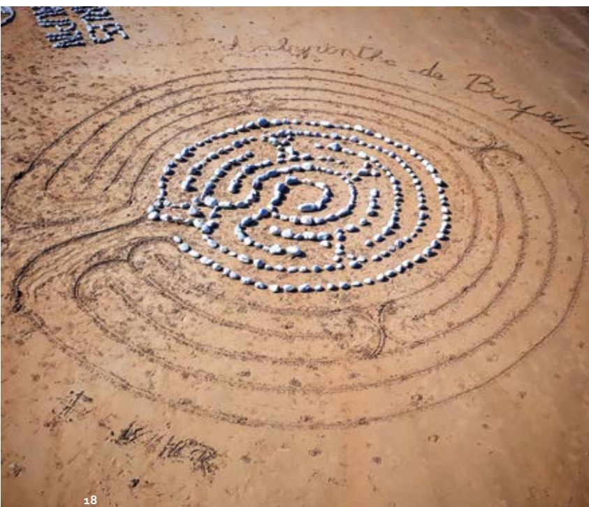
Méditation dans un labyrinthe

Réservation sur le site du réseau de lecture publique mediathèques.mond-arverne.fr