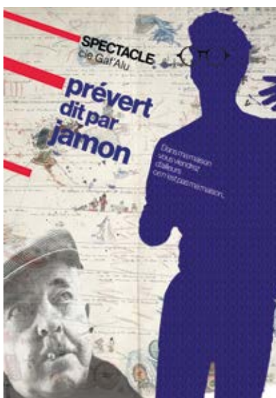
© Gaf'Alu - Dans ma maison vous viendrez, d'ailleurs ce n'est pas ma maison