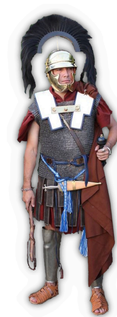
Centurion époque césarienne

Le choix du nom de la rue s'explique bien entendu par la proximité du grand camp.