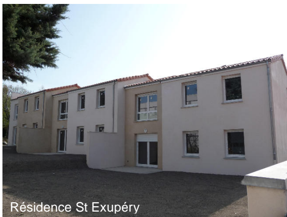
Résidence St Exupéry